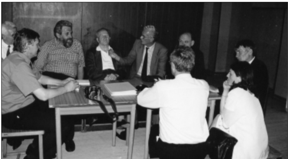
Делегачії Союзу Русинок и Українок Републики Горватскеї и Союзу Русинок и Українок Югославії на стретнуцу и розгварки у Свидніку у Словацкеї 2000. року