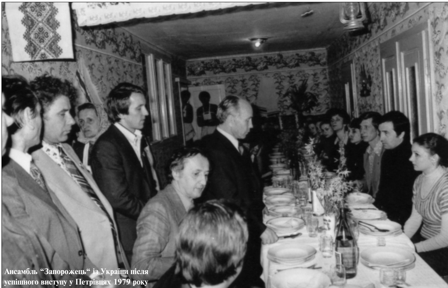
Ансамбль “Запорожешь” із України після успішного виступу у Петрівцях 1979 року