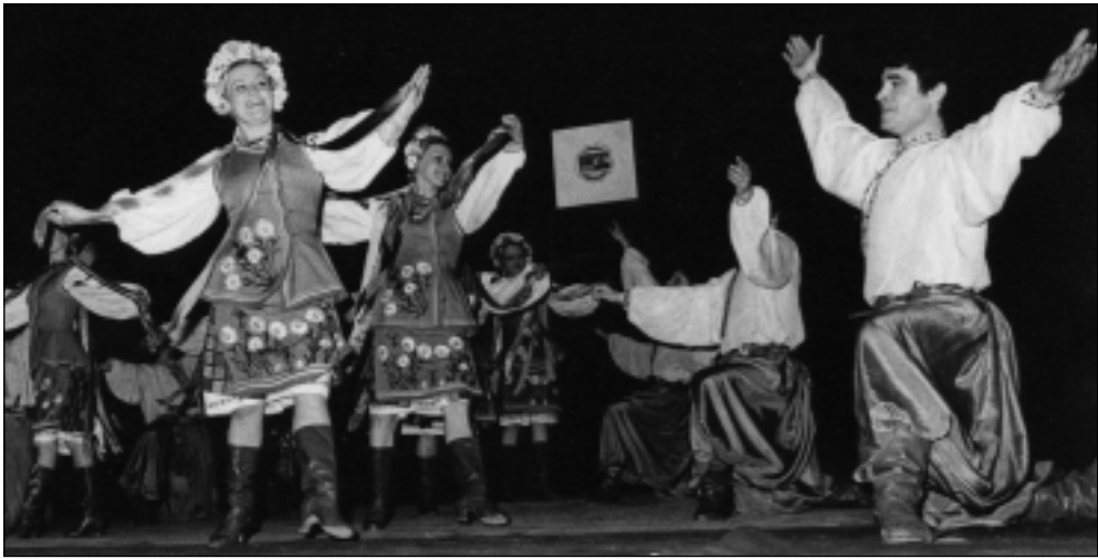
“Запорожец“ у Вуковаре, 25. марта 1979. року